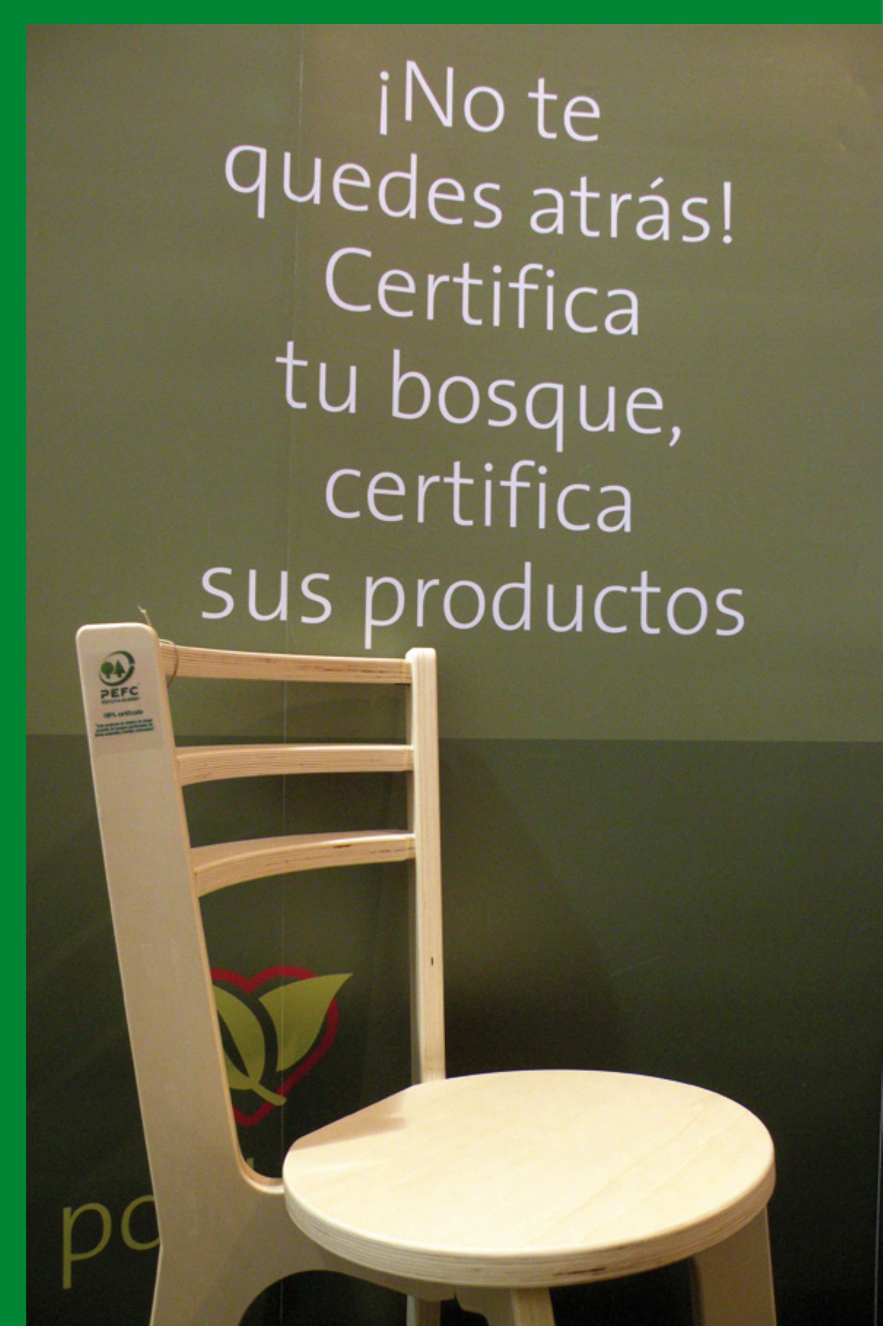
Mobiliario Certificado del 5º Congreso Forestal Español